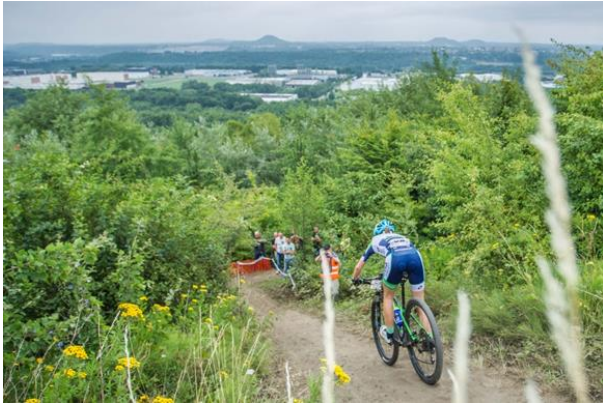
Afbeelding: Sfeerimpressie NK Mountainbike 15 en 16 juli

De verbetering en vernieuwing van de bestaande mountainbikeroutes in Parkstad is afgerond in 2017. De vrijwilligers van Mountainbikeclub Discovery hebben in 2017 meer dan 1.000 uur ingezet voor het aanbrengen van deze verbeteringen! Deze routes zijn met succes gebruikt tijdens het Nederlands Kampioenschap Mountainbiken in juli 2017.