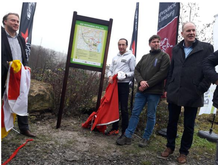
Afbeelding: Mountainbike legende Bart Brentjens opent de Sint Pietersbergroute

In 2017 is gestart met het ontwerp en aanleg van de St. Pietersbergroute, een fraaie route die over Nederlands en Belgisch grondgebied voert en waar intensief en succesvol met Nederlandse en Belgische overheden is samengewerkt. Om deze route te realiseren is een trailcrew opgeleid met vrijwilligers uit Maastricht en omgeving. Alleen al voor deze route zijn circa 3.000 vrijwilligersuren ingezet. De route is op 22 december 2017 feestelijk geopend door MOZL-ambassadeur en mountainbikelegende Bart Brentjens. Inmiddels heeft deze route zich genesteld in de top 10 mountainbikeroutes in Nederland.